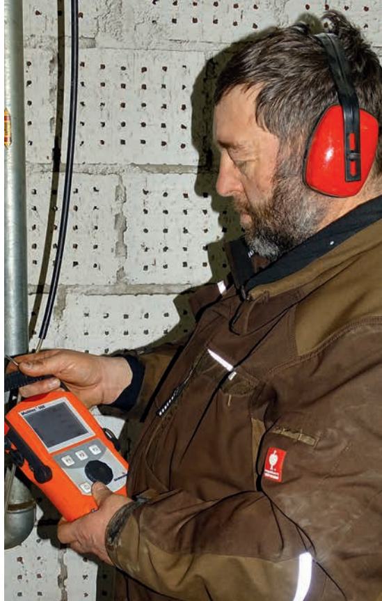
Passen die Werte? Der Biogasfachberater überprüft auf den Anlagen u. a. den Methan-, CO 2 -, Sauerstoff- und Schwefelwasserstoffgehalt.

sagt er. Bei seinen Besuchen führt er Messungen des Methan-, CO 2 -, Sauerstoff- und Schwefelwasserstoffgehalts durch, ermittelt den FOS/TAC-Wert des Gärsubstrats, um Aussagen über die Belastung der Anlage treffen zu können, und prüft mit dem Leckagesuchgerät, ob es am Fermenter oder an den Leitungen undichte Stellen gibt. In seinem Transporter hat er ein mobiles Labor, das ihm die Analysen vor Ort ermöglicht. Stellt er von der Norm abweichende Werte fest, wird es knifflig. Dann geht er auf Ursachenforschung, um möglichst schnell eine Lösung anbieten zu können. Und wenn er Extremwerte misst, dann leitet er die Proben sogar zur genaueren Untersuchung an ein Labor weiter.