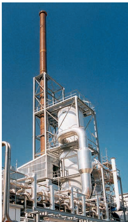
Das Holz aus lokalen Anbaugeländen wird in mehreren Stufen in Drehrohren und Mahlanlagen zu Aktivkohle verarbeitet.

erhöht sich die Produktionskapazität um bis zu 40 Prozent. Zusätzlich ist die Zertifizierung des Standorts nach NSF-Standard, der für Aktivkohleprodukte für die Trinkwasseraufbereitung in den USA und vielen anderen Ländern gefordert ist, entscheidend. „Unter diesen Voraussetzungen können wir verstärkt Ausschreibungen für den Trinkwassermarkt bedienen und unsere hochwertigen Aktivkohleprodukte an einen größeren Kundenkreis liefern“, so Neuroth. Eine gut ausgebaute Logistik inklusive eigenem Eisenbahnanschluss gewährleistet die Auslieferung in den jeweils gewünschten Verpackungen und Ladungen. Und schlussendlich wurde im Mai ein neuer Verkaufsleiter eingestellt, seit Juni leitet eine Führungskraft aus Frankfurt die Geschicke der Donau Carbon LLC vor Ort als CEO. Neuroth fasst zusammen: „Indem wir die Produktionsmenge von Pulveraktivkohle erhöhen und gleichzeitig das Handelsgeschäft ausbauen, stärken wir unsere Position am US-Markt.“ ■