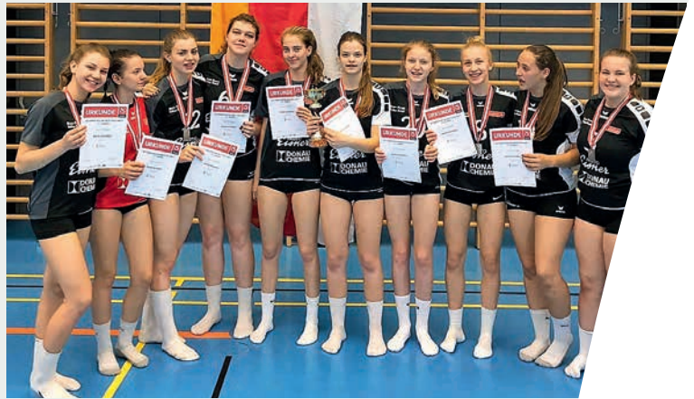
U17-Vizestaatsmeisterinnen: Der Nachwuchs der Donau Chemie Hot Volleys Brückl ist topfit.