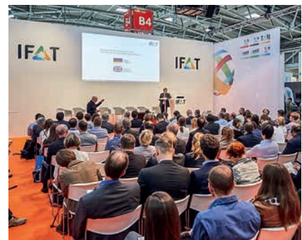
Outdoor und indoor präsentierten Aussteller aus der ganzen Welt die neuesten Umwelttechnologien.