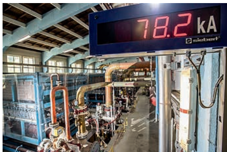
Die Stromstärke in der Elektrolyse muss konstant hoch sein.