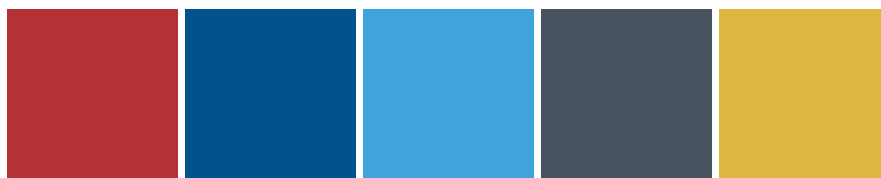
Donau Chemie Wassertechnik Donauchem Donau Carbon Donau Kanol