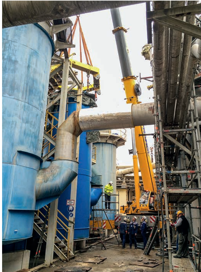
Bei einer der letzten Revisionen wurde ein neuer Absorptionsturm in die Anlage gehoben (rechts). Darin entstehen ca. 90 Prozent der Schwefelsäure (links).