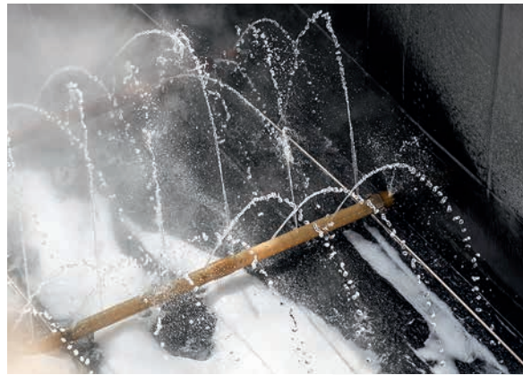
Meeresbrise: Wenn in der Elektrolyse heißes Wasser und Salz aufeinander-treffen, entsteht gesunder Dampf.